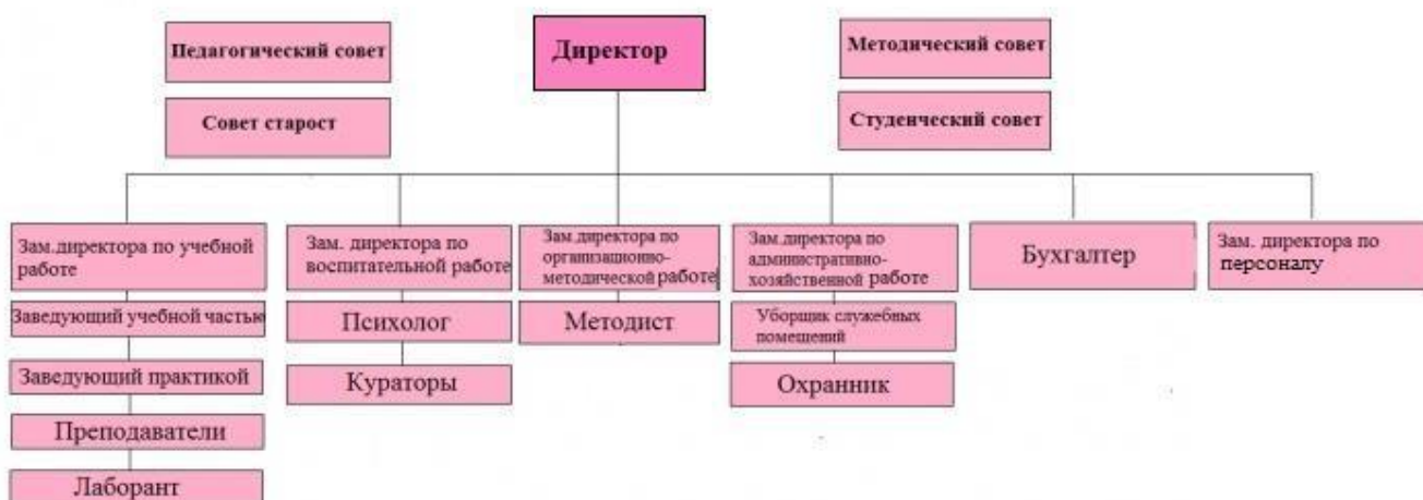
Структура Медицинского колледжа

Управление Колледжем осуществляется в соответствии с законодательством Российской Федерации с учетом особенностей, установленных Федеральным законом «Об образовании в Российской Федерации» от 29.12.2012. № 273-ФЗ, в соответствии с Уставом Колледжа и строится на основе сочетания принципов